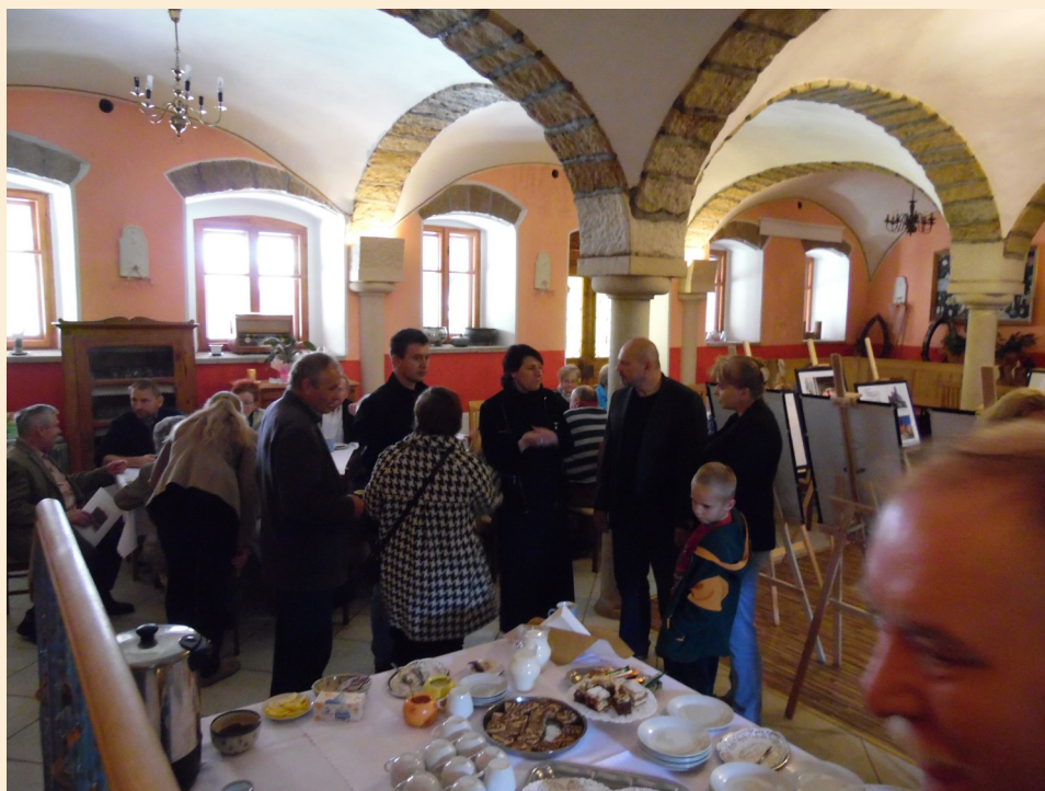
Kaffeetrinken mit Ausstellung

Im Anschluss wurden die Anwesenden zum Kaffeetrinken in den Saal der Agrotouristik „Stare Siedlisko“ eingeladen, wo eine kleine Ausstellung zu Wünschendorf eine ganze Woche lang zu bestaunen war.